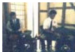
ただいまお点前中

5月18日に尾道の今川茶舗で尾道みなと祭り合同茶会があり、私たち商船茶道部の学生も参加しました。今回のお茶会では主催者川として参加し、お点前と半東しました。お点前とは茶道のきめられた作法をもとに、お茶をお客様にふるまう役です。それに対して半東とはいわばお茶会の司会者みたいなもので道具の説明などをする役です。今回のお茶会は私たちの出番がたくさんあり、普段の練習では学ぶことの出来ないものを得られました。お茶会の会場はみなと祭りのパレードルートと隣接しており、いきなり大きな音でサンバのパレードがあつたりして、普通のお茶会とは違ひ、わりとくだけた感じのお茶会だったと思います。