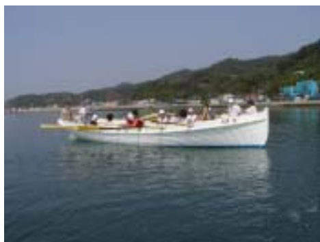
はじめて漕ぐカッター