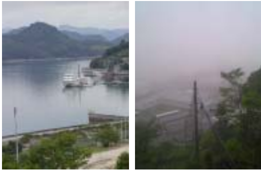
学校から見た広島丸 (左:通常 右:霧発生)

今日から実習だと思って朝起きていざ乗船してみると、いきなり霧が出てきた。箱島も見えないほどの深い霧だった。これは出航できないほどの深い霧だった。霧が引いてきて出航準備にかかったが、また雨が降ってきて霧が出てきた。そんな状態を繰り返してうちに気づいたら三十分以上出航が遅れてしまった。天候もあいにくの雨で、引率の教官も嘆いていたし、見送りの人も少なくて残念だった。航行中も視界の悪く、広島⇩神戸という長距離の移動なので、大変だった。二日目には加藤汽船のフェリーを見学した。船内見学のほかに、船長のお話しを伺う機会があったが、仕事は二日働いて二日休むという日程のうち働いている二日間は眠れないと言う事を聞いて少し不安になった。その後、神戸海洋博物館で船の歴史やいろいろな民族の船の模型、航海・造船・港湾技術などを学んだ。